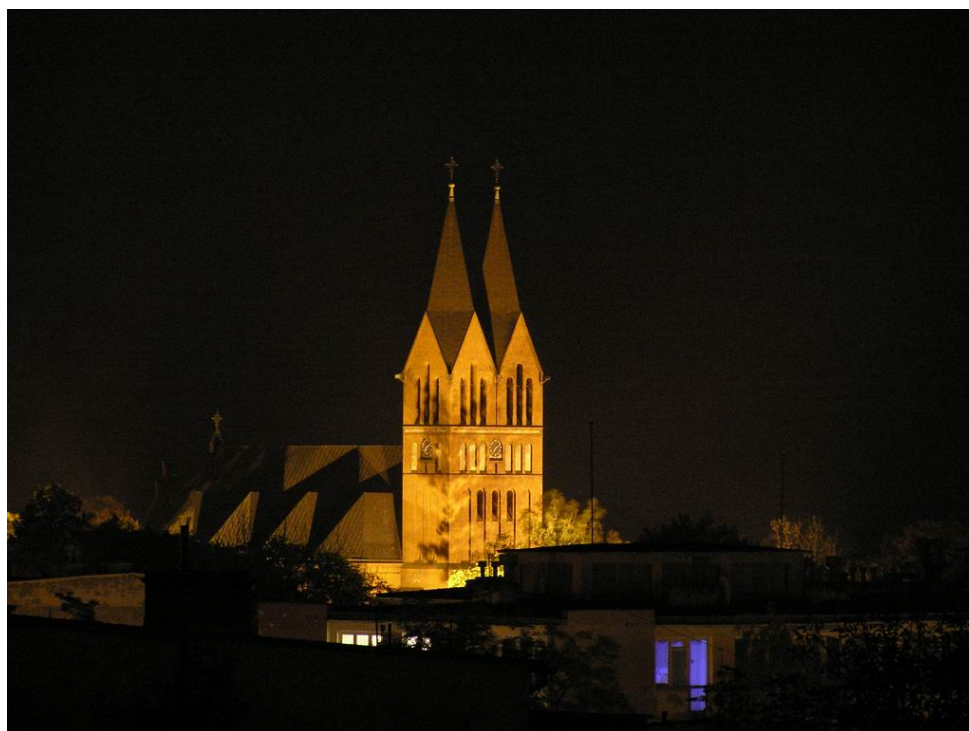
Kościół św. Andrzeja Boboli