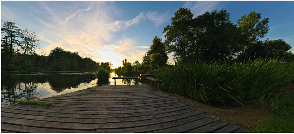
Przystań kajakowa koło młyna w Przechowie