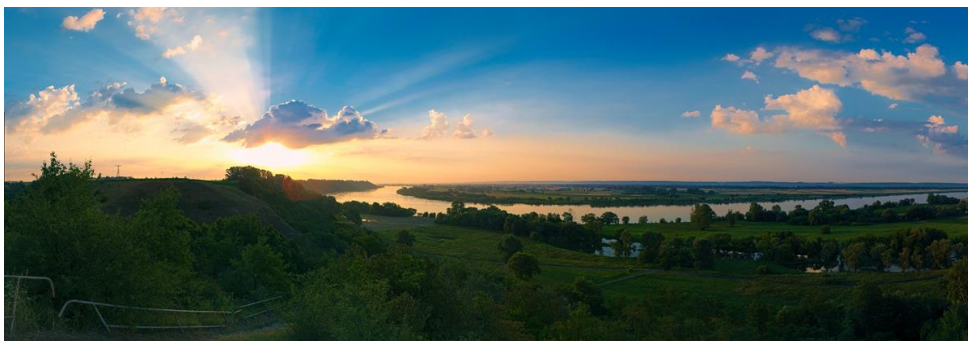
Ujście Wdy do Wisły. Widok z

Zapraszamy Państwa do nadsyłania swoich fotografii (zasady zabawy podajemy pod prezentowanymi zdjęciami Michała Sługockiego).